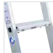
Stufenmodul MaxxStep Bestell-Nr. 19901 – 19905