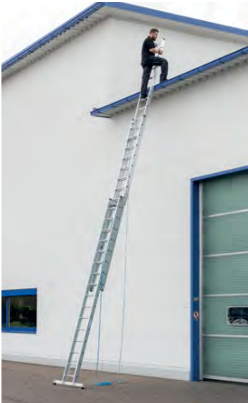
Abb. Bestell-Nr. 22416