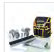
Ergonomie Bestell-Nr. 19329