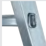
4-fach gebördelte Sprossen-/ Holmverbindung

Details auf der jeweiligen Produktseite unter www.steigtechnik.de